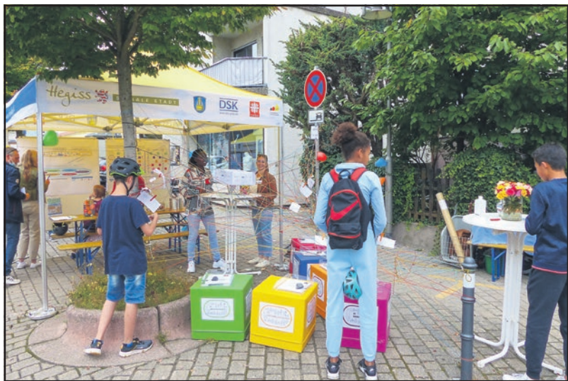
Stand der Sozialen Stadt an der Stadtrallye 2021 mit interaktivem Gesamtbeiratsmodell zum Anfassen

In jeder der sechs Interessengemeinschaften (IG) wurden bei deren sechs dritten Treffen die im Vorfeld gesammelten Ideen, Wünsche und Anliegen gesichtet und in Rubriken und Ziele geordnet. Bei den jeweils vierten Treffen werden nun in jeder IG zwei Vertreterinnen und Ver-