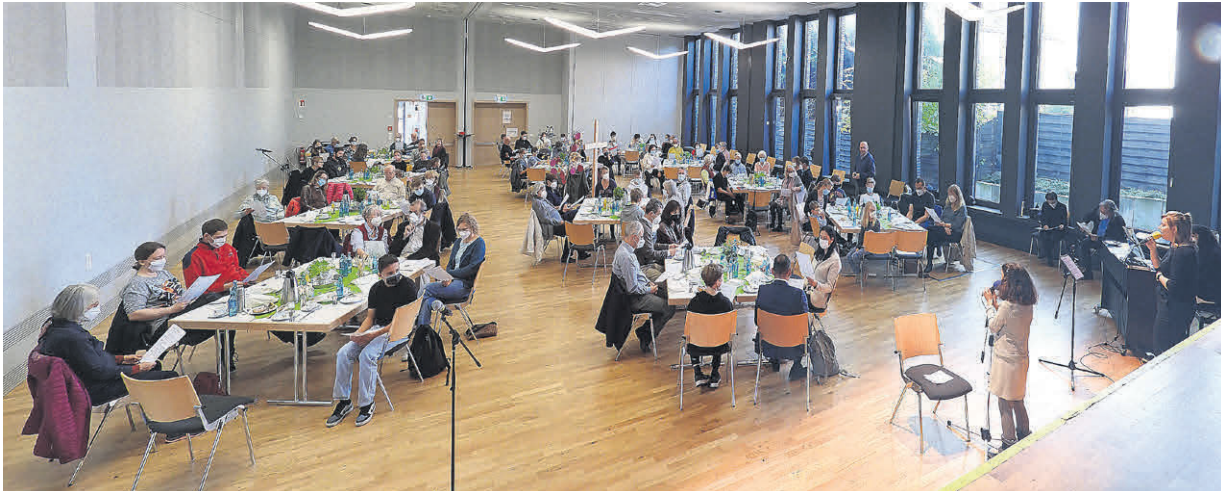
FEIERABENDMAHL FÜR ALLE - „Vom Untergang und Apfelbäumchen“ - Musikalischer Gottesdienst zum Reformationstag mit gemeinsamem Mahl. Diskussion der Konfirmandinnen und Konfirmanden mit den Gottesdienstbesuchern zu den Themen der Jugend heute.

Nun möchte der Kirchenvorstand diese Entwicklung vertiefen: Die ökumenische Beziehung zu den katholischen Christen soll stärker mit den evangelischen Gemeinden und der kath. Gemeinde St. Ursula in Oberursel koordiniert und gestaltet werden. Dies ist im Rahmen einer übergemeindlich vernetzten evangelischen Jugendarbeit bereits angelaufen. Zusammen mit Gemeinden in Oberursel und Unterstützung einer Gemeindepädagogin des Dekanats Hochtaunus bündelt die St. Georgsgemeinde ihre Erfahrungen und Aktivitäten der Kinder- und Jugendarbeit. So wird auch die traditionelle Segelfreizeit künftig gemeinsam organisiert und durchgeführt. Durch Kooperation und Ressourcenteilung wird das Engagement der Gemeinde zukunftsfähig aufgestellt.