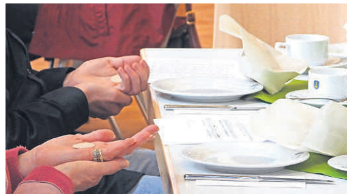
Gemeinsam am Tisch des Herrn - Abendmahl auf neuen Wegen im Steinbacher Bürgerhaus - Oblaten, Traubensaft und Luther-Gebäck zum Kaffee am Reformationstag.

ung auf die „Gastfreundschaft“ der Ev. St. Georgsgemeinde und Offenheit gegenüber allen Menschen im Interreligiösen Dialog möchte der Kirchenvorstand ein zeitgemäßes Profil von Kirche vermitteln und neue Wege zu den Menschen gehen. Zuletzt wurden am Reformationstag bei einem Feierabendmahl im Bürgerhaus alle Steinbacherinnen und Steinbacher zum gemeinsamen Gottesdienst und einem gemeinsamen Essen eingeladen. Weiterhin sollen auch Kontakte zur moslemischen Ahmadiyyagemeinde, die punktuell in der Vergangenheit bereits stattgefunden haben, vertieft werden. Wer daran mitwirken will, ist herzlich dazu eingeladen.