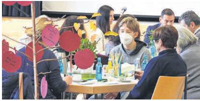
Kreative Konzepte zur Gestaltung von lebendigen Gottesdiensten bringen Menschen zusammen - über konfessionelle Grenzen hinweg.

Mit „offenen“ Gottesdiensten unter der Überschrift „Ein Mahl für alle“ und Chorprojekten unter dem Motto „Musik für alle“ geht die St. Georgsgemeinde bereits seit einigen Jahren über das ökumenische Miteinander der beiden christlichen Kirchengemeinden in Steinbach hinaus und sucht bewusst den Dialog zu den Steinbacher Menschen, die einer anderen oder keiner Religionsgemein-