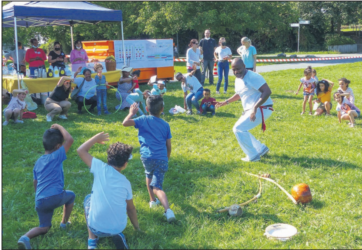
Viel Spaß für Groß und Klein bei Capoeira anlässlich der Auftaktveranstaltung IG Familien.