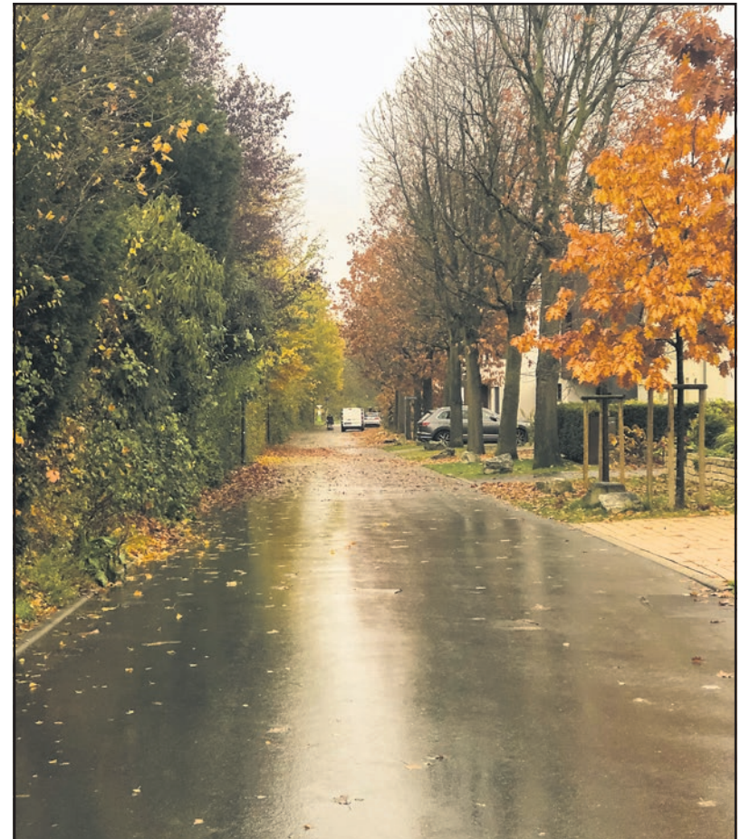
Der gerade Praunheimer Weg verleitet leicht zu schnellem Fahren

„Welche weiteren Maßnahmen sieht die Verwaltung als Möglichkeit für einen effektiveren Verkehrsberuhigung am Praunheimer Weg/Taubenzehnten?“, dies möchte die Stadtverordnete der CDU-Fraktion, Iris Diener auf der letzten Stadtverordnetenversammlung wissen. Bereits bei der Entscheidung über das Baugebiet Praunheimer Weg war die Verkehrsbindung ein kritischer Punkt. Inzwischen hat sich gezeigt, dass viele Autofahrer trotz der Beschilderung deutlich zu schnell fahren. Oft sind auch Fahrradfahrer mit erhöhter Geschwindigkeit unterwegs und gefährden Schul- und Kindergartenkinder auf ihrem Weg z. B. zur Geschwister-Scholl-Schule.