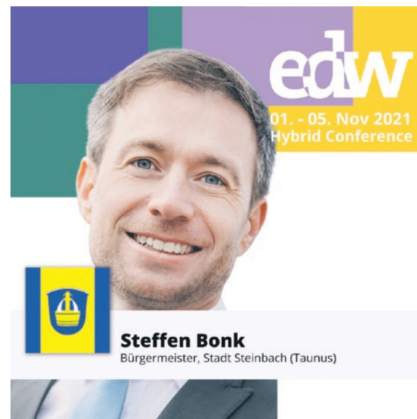
Steffen Bonk Bürgermeister, Stadt Steinbach (Taunus)